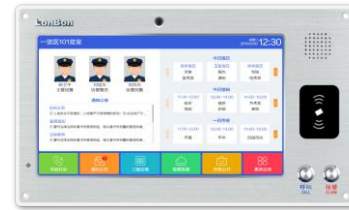
(支持人脸、刷卡识别录入)