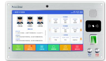
(支持人脸、指纹、刷卡识别录入)